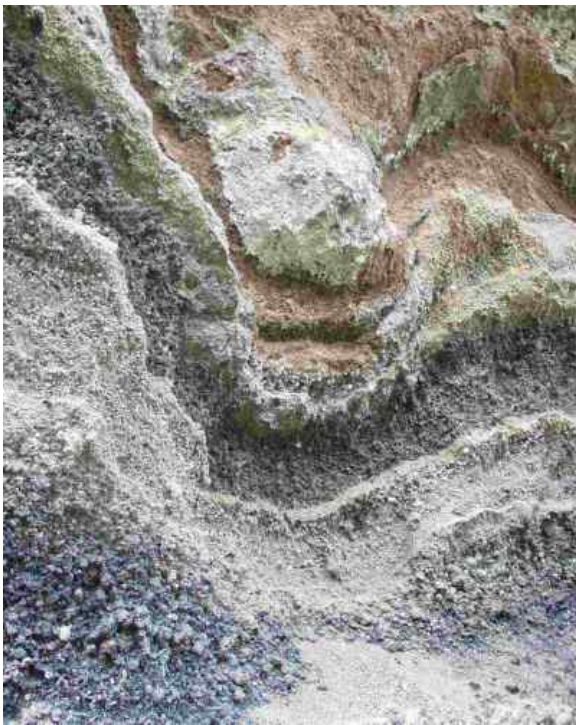
Einschlagskrater einer Lavabombe

nachströmendes Wasser hielt diesen Prozess aufrecht, bis keine vulkanischen Massen mehr nachgeliefert wurden und die Energien abgebaut waren.