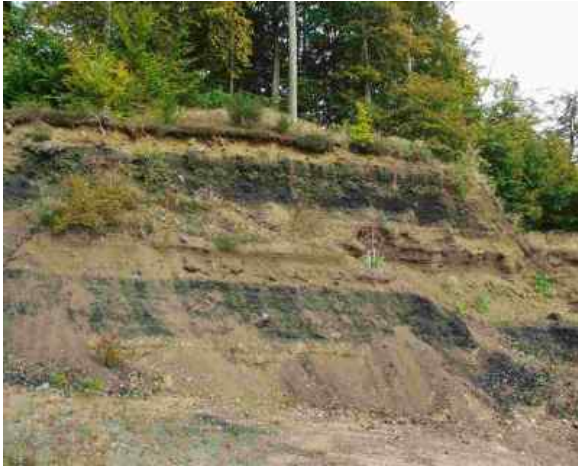
Schlackengrube Retterath: Hellbraune Maartuffe in Wechsellagerung mit dunklen Ablagerungen des Schlackenvulkans 1